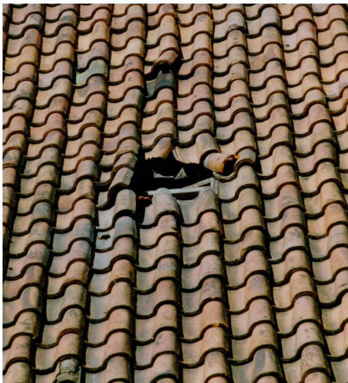
Figure 3: De meteoriet vernielde vier dakpannen en versplinterde het dakbeschoot daaronder.

gemaakt. Zeker daar waar sprake is van summier en vaak twijfelachtig waarnemingsmateriaal is het goed, om verschillende onderzoeksteams onafhankelijk reductie te laten uitvoeren. In deze Radiant geven we resultaten en bevindingen van allen, die zich bezig hebben gehouden met de Glanerbrug val. Overigens hebben de astronomisch betrokkenen in die periode enkele gezamenlijke bijeenkomsten gehouden, waarop gegevens werden uitgewisseld.