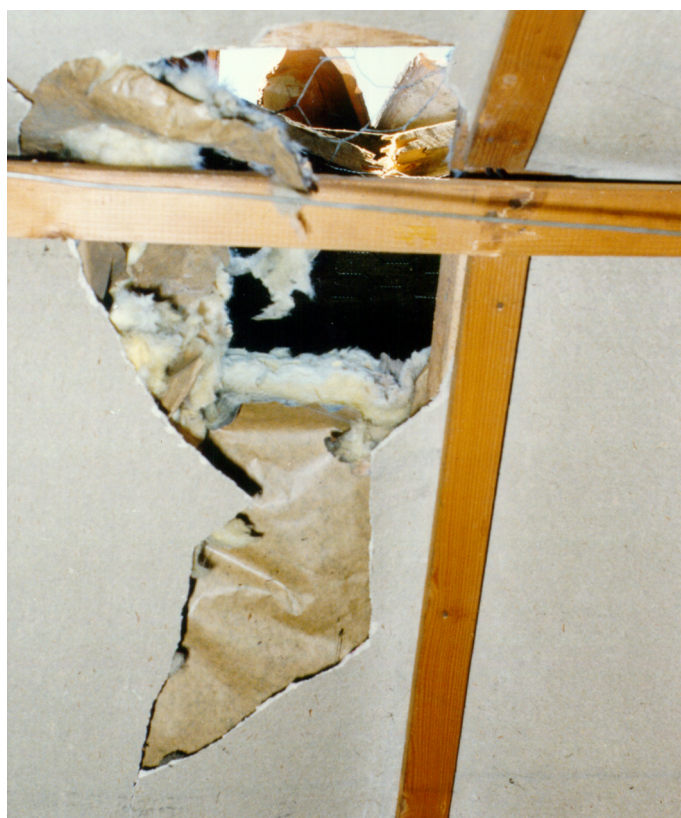
Figure 4: Deze foto toont duidelijk de ravage aan de binnenzijde van het dak.