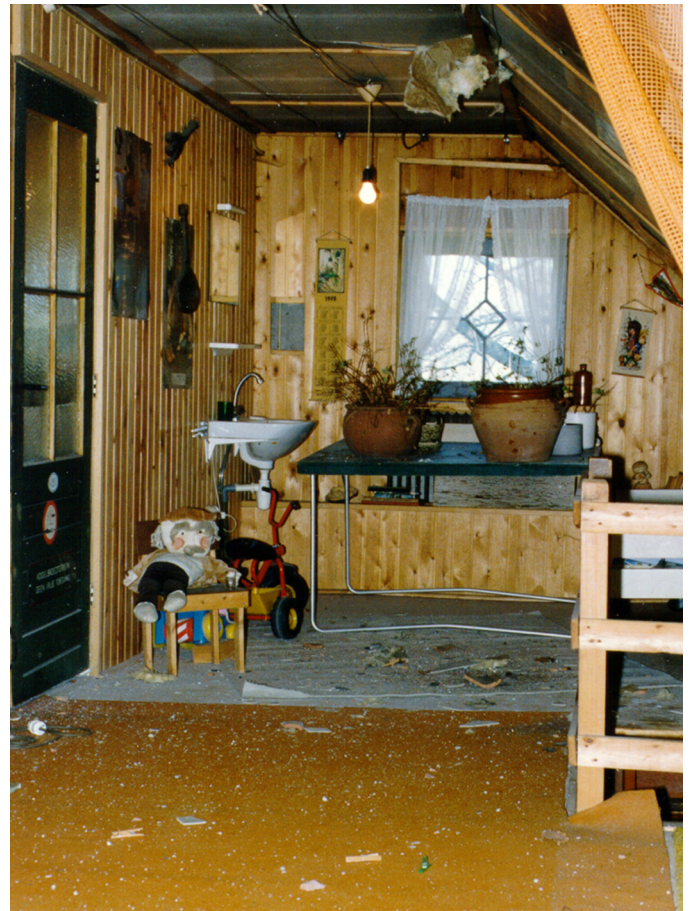
Figure 1: De zoldervloer was bezaaid met grotere en kleinere fragmenten, vermengd met dakpangruis. Rechts naast de lamp is de schade aan het dak zichtbaar.

Op dinsdag 10 april kopte ‘de Telegraaf’ in een voorpagina artikel de val van een meteoriet in Enschede, compleet met foto van het vernielde dak en een man, die later de toevallig tegelijkertijd aanwezige dakdekker bleek te zijn, die de schade kwam opnemen. Hoewel de conclusie ‘meteoriet’ voorbarig was, bleek die later juist te zijn. Het bewuste artikel in de Telegraaf werd hiermee koploper voor nog een hele reeks publiciteitsevenementen, die het wetenschappelijk onderzoek een beetje dreigden te overschaduwen.